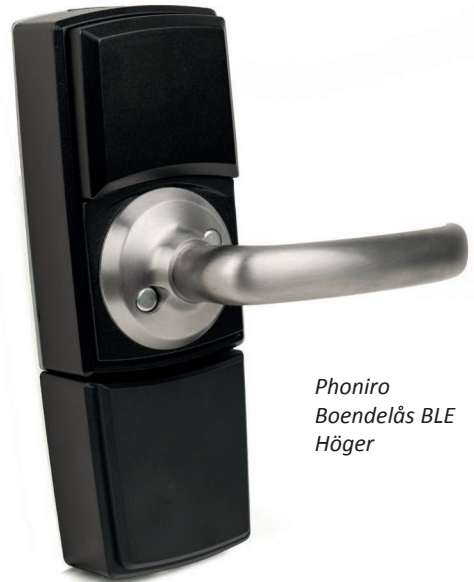
Phoniro Boendelås BLE Höger

Antal per förpackning: 1 st Normal leveranstid: 10-15 arbetsdagar