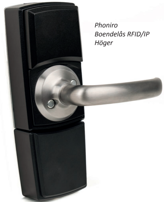
Phoniro Boendelås RFID/IP Höger