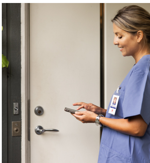
Låsenheten syns inte från utsidan vilket ökar tryggheten för omsorgstagaren.

*Från det att man trycker på "Läs upp" i Home Care-appen till dess att man kan öppna dörren och gå in. Baserat på ett genomsnitt på 100 upplåsningar och när låset är monterat på en standard ASSA 310-låskista.